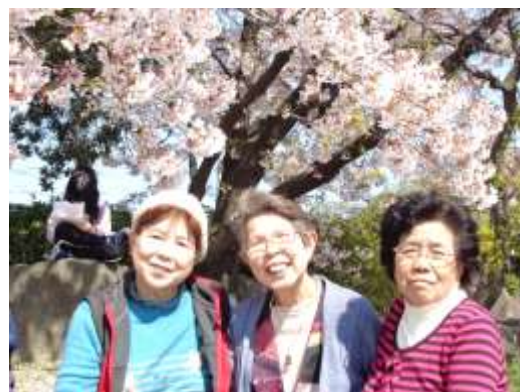
ボランティアさんと一緒に記念撮影

ご利用者の中には、スタッフと一緒に広場を散策しながら一周される方や、桜の木の下で花見を楽しむ方等楽しみ方は様々です。